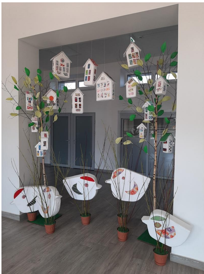
Στην είσοδο του σχολείου