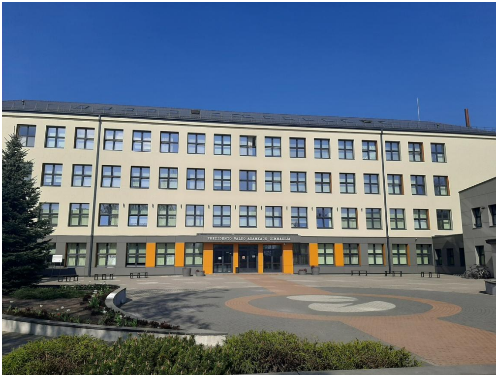
Prezidento Valdo Adamkus Gimnazija, σχολείο υποδοχής

Κατά τη διάρκεια της μετακίνησης τρεις εκπαιδευτικοί του σχολείου συμμετείχαν σε παρακολούθηση εργασίας (job shadowing) στο σχολείο Prezidento Valdo Adamkus Gimnazija στο Κάουνας. Εκεί παρακολούθησαν μαθήματα (αγγλικών, μαθηματικών, γλώσσας, ιστορίας, κοινωνιολογίας κ.α.), ενημερώθηκαν για τα Ευρωπαϊκά και περιβαλλοντικά προγράμματα του σχολείου, για τις διδακτικές προσεγγίσεις που ακολουθούν οι εκπαιδευτικοί και ξεναγήθηκαν στις εγκαταστάσεις του σχολείου. Το σχολείο έχει ενεργό συμμετοχή σε προγράμματα περιβαλλοντικής εκπαίδευσης και του έχει απονεμηθεί η σημαία αειφορίας από τον εθνικό τους φορέα.