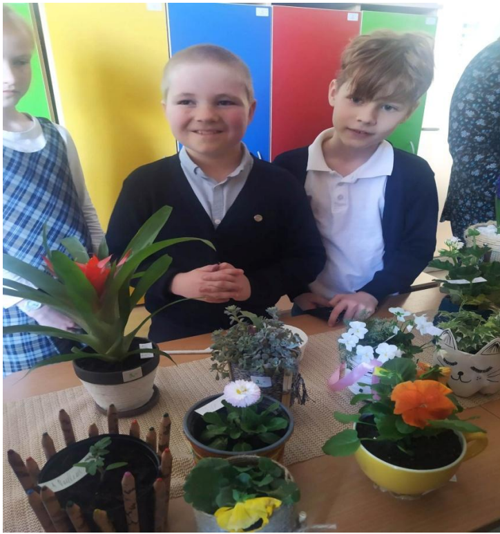
Στην ημερίδα "Eco ideas for Lithuania"