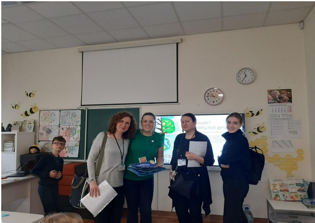
Κατά την παρακολούθηση μαθημάτων με συναδέλφους από την Εσθονία